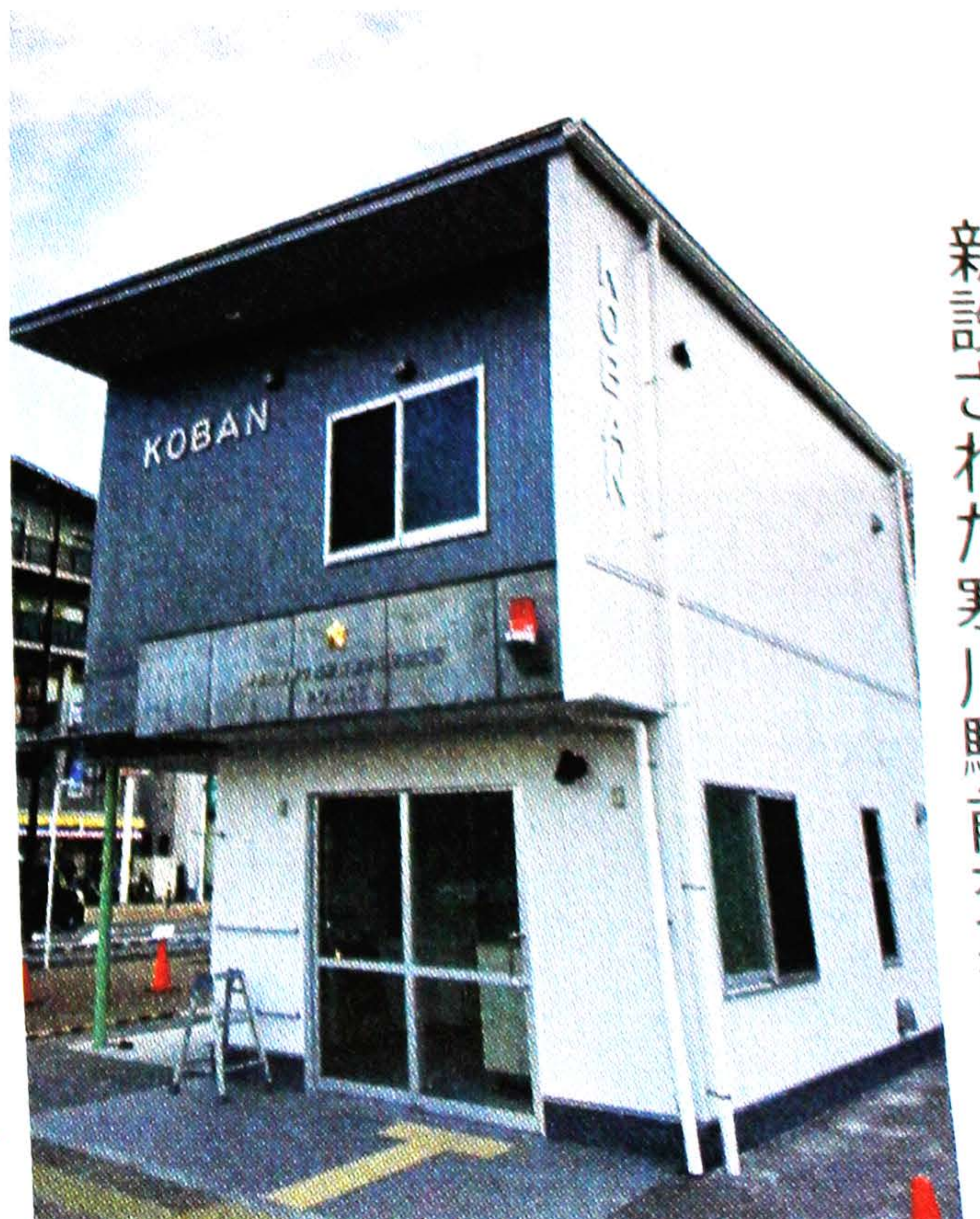
新設された寒川駅前交番

設が進められています。そ して懸案でありました、寒 川駅前交番の建設も昨年よ り進められました。寒川駅 前交番は寒川駅及び駅周辺 地域の治安強化を図るとき に役立ちます。